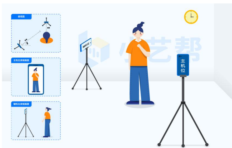
图 2 面试主辅机示意图